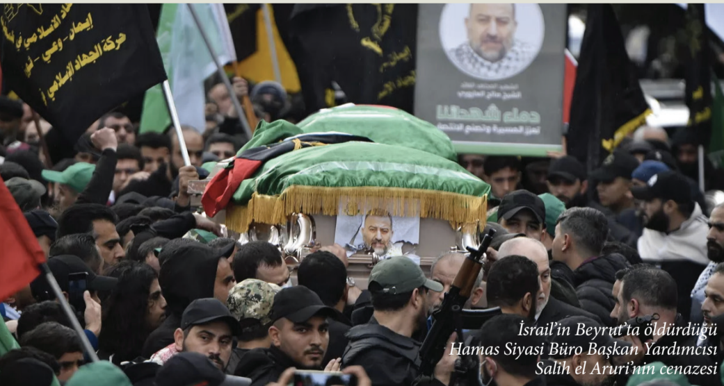
İsrail'in Beyrut'ta öldürdüğü Hamas Siyasi Büro Başkan Yardımcısı Salih el Aruri'nin cenazesi

Kapitalizmin krizi dolayısıyla büyüyen hegemonya mücadelesi ABD'nin bölgeye tamamen girmesine sebep olduğu takdirde bu "özen" ve "sabır" bozulabilir. Sabırın ve özenin bozulması ise Orta Doğu'nun daha önceki savaşları aratacak derecede kan denizine dönmesine neden olabilir.