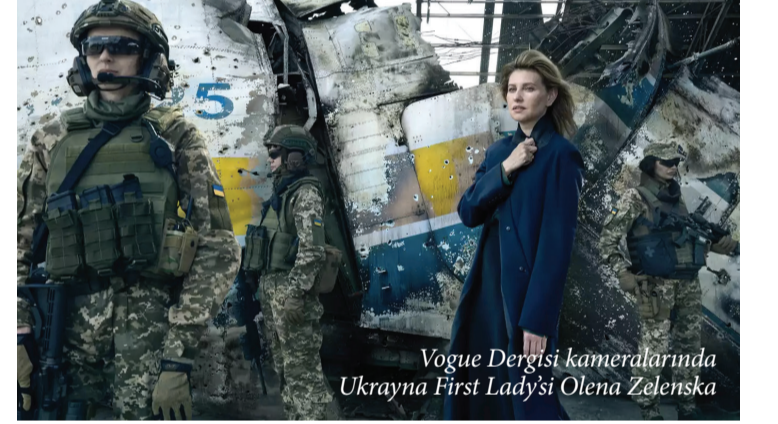
Vogue Dergisi kameralarında Ukrayna First Lady'si Olena Zelenska

Daha önce, savaşın Ukrayna için daha kötü bir şekilde değil, öngörülebilir bir gelecekte sona ereceğine dair bir inanç olduğu için daha derine iniliyordu, ancak şimdi bunun yakın zamanda bitmeyeceği ve sonucunun Ukrayna için oldukça felaket olacağı açıkça ortaya çıktı. Batı'nın tedarikleri de zirveye ulaştı ve ardından azalmaya başladı: Ukrayna'nın ortakları askeri üretimlerini yeterince yüksek bir hızda artırmamıştı üstesinden gelemedi. Ayrıca dünyada başka büyük krizlerin yaşanmadığı ve her şeyin Ukrayna'ya verilebileceği zaman penceresi de kapandı. Şimdi İsrail - Filistin savaşı var, Tayvan'da sular ısınıyor ve bu sebeple Ukrayna daha önce aldığı finansal desteği artık alamayacak. Rusya'nın savaş ekonomisi bölümünde ifade edildiği gibi savaşın mutlak zaferi için iktisadi planlamasını ve örgütlenmesini gerçekleştiren Rusya devletinin kapitalist zümresi, yıpratma savaşı stratejisine devam ederek Dünya'daki diğer gelişmelerin de etkisiyle savaşta konumunu güçlendirdi. 2024 yılı içerisinde savaşın gidişatı ne olur kes-tirmek çok güç olsa da ABD başkanlık seçimleri Ukrayna'nın durumunu doğrudan etkileyeceği benziyor.